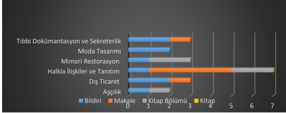
Tablo 3. Program bazında akademik çalışma türleri dağılımı

2020 yılında hazırlanan akademik çalışmalara ait tablo aşağıdaki gibidir.