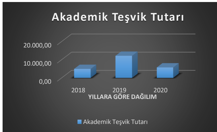
Tablo 2. Akademik teşvik tutarları – yıllara göre dağılımı

Meslek yüksekokulumuz bünyesinde yer alan programların farklı disiplinlere sahip olması akademik çalışmalarda da çeşitliliğin sağlanmasına katkıda bulunmaktadır. Bu bağlamda programlar bazında hazırlanan akademik çalışmalarla ilgili tablo aşağıdaki gibidir. Tabloya bakıldığında Aşçılık Programında bir bildiri ve 1 kitap bölümü, Dış Ticaret Programında iki bildiri, bir makale, Halkla İlişkiler ve Tanıtım Programında bir bildiri, dört makale, dört kitap bölümü ve bir kitap yazarlığı, Mimari Restorasyon Programında bir bildiri ve iki kitap bölümü,